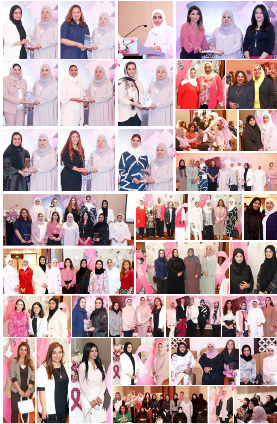
فريق العمل : مدير أول إدارة قسم المبيعات والتسويق: دليلة أرناؤوط - التنظيم: كوثر جاسم زينب سوار، فاطمة قمبر، وفاء غلوم، صفية الحداد، شذى أحمد تصميم: كوثر جاسم - تحرير: سعيد محمد، فاطمة عبدالله، منال الشيخ - تصوير: حسن عبدعلي، حوراء مرهون، عبدالرسول الحجيري، خليل إبراهيم - الإسناد التقني: سعيد مبارك، عبدالله يوسف