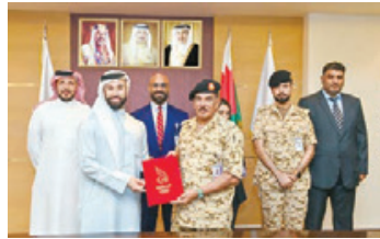
○ جانب من توقيع الاتفاقية.

الطبية المتميزة ليتمكنوا من تمثيل المنتخبات الوطنية خير تمثيل.